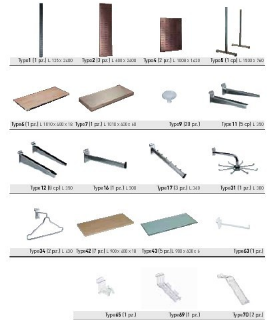
Esempi di combinazione delle strutture VIRTUAL.