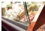
1_Banco Ikarus e murale refrigerato integrato nel retrobanco. 1_ikarus counter and cooled wall unit integrated in the back-counter.