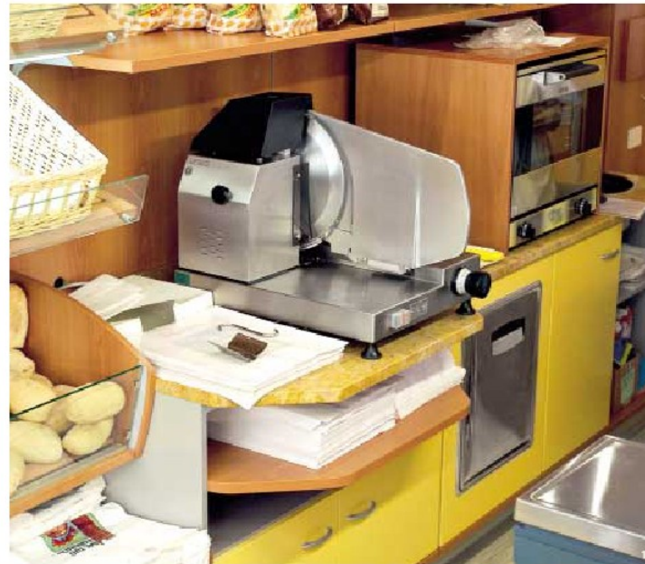
3_Particolare dell'alloggiamento porta affettatrice, con apposito vano portacarta. 3_Detail of the slicer holder, with paper holder space provided for the purpose.