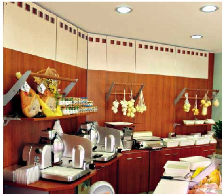
4_Banco Ikarus refrigerato con retrobanco attrezzato, rifinito con valotta superiore in lamiera. 4_Cooled Ikarus counter with equipped back-counter, finished with upper metal valance.