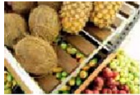
1_Dettaglio del pianale della gondola, con elemento decorativo in lamiera. 1_Detail of the gondola flat panels, with metal decorative element.