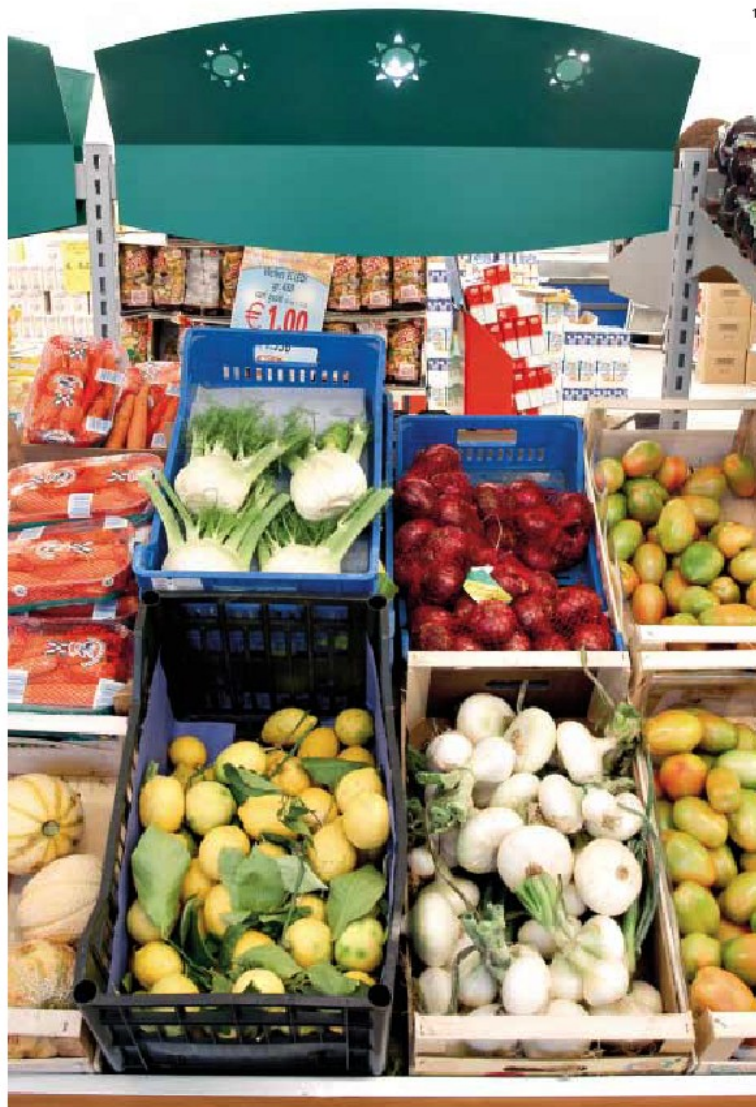
2_Di scorcio, l'ampia superficie espositiva, laterale e frontale, della gondola. 2_In perspective the wide display surface of the gondola, lateral and frontal.